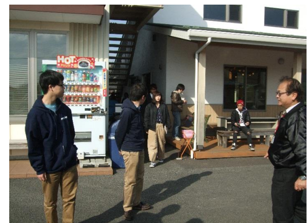
⑥避難後の人員確認