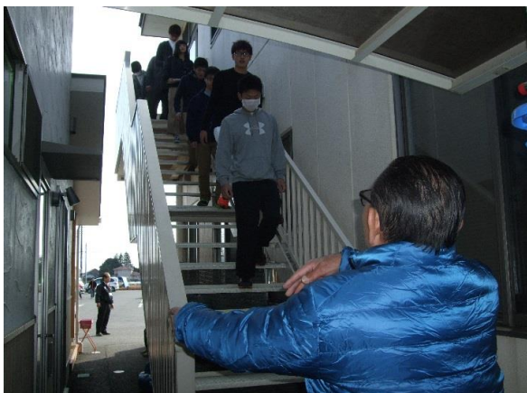
⑤誘導状況(非常階段を使用しての避難)