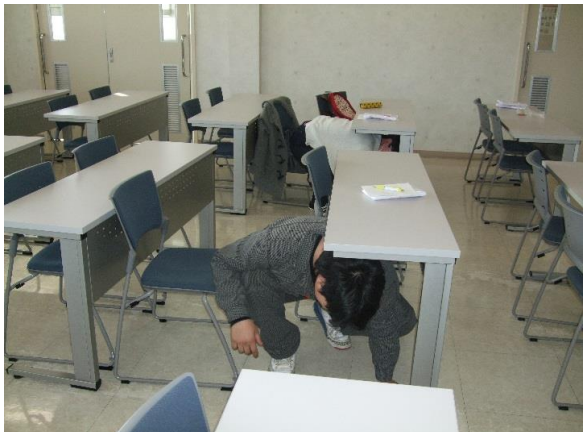
③地震発生時に自分の身を守る安全行動