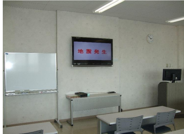
②地震発生を知らせる表示