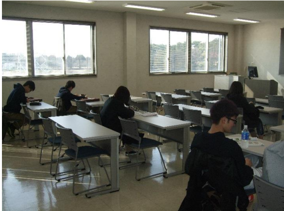
①学科教習中の状況

教習生からは、「非常階段の場所や地震発生の際に自らがとる行動がわかりました」と話もありました。